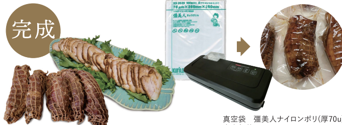
真空袋 福美人ナイロンポリ(厚70μ) 真空包装器 FOOD SHIELD JP290